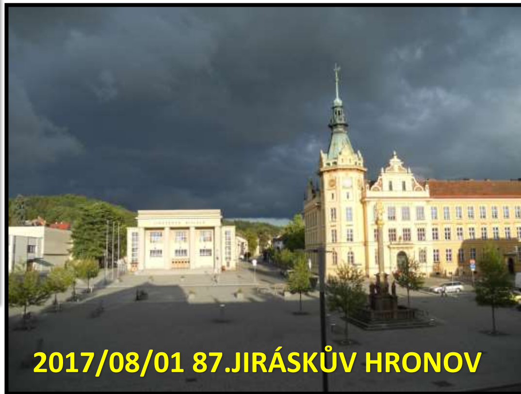
2017/08/01 87.JIRÁSKŮV HRONOV